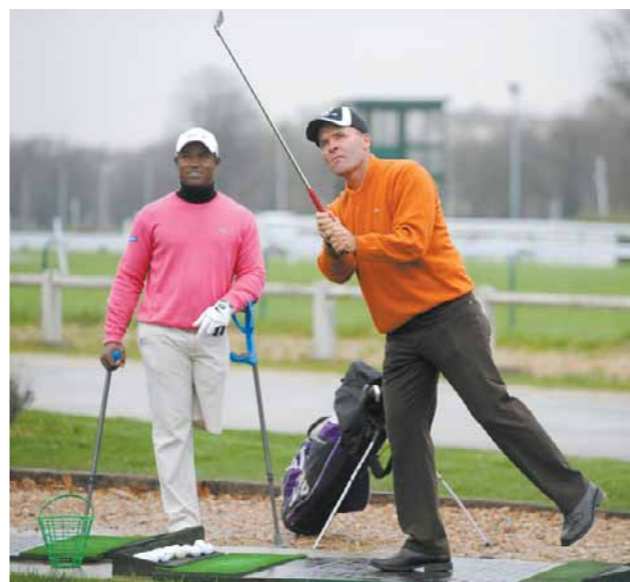
PARIS, HIPPODROME D'AUTEUIL, 11 DÉCEMBRE 2009

210 mètres, c'est bien. » De Los Santos envoie lui à 240 mètres. « Mais le plus impressionnant, c'est dans le petit jeu, glisse Levet. Là, tout se fait avec le poids de corps sur le pied gauche. » Celui qui n'a plus de Los Santos. « Si je ne mets que sur la jambe droite, ma balle va n'importe où », promet Levet. Deux essais hésitants au putting-green, et la pluie rappelle tout le monde au clubhouse. « Ce qui est compliqué pour Manu, c'est qu'il ne peut pas se fier à ce qu'il y a dans les bouquins, dit Levet. Ce qu'il réussit, c'est vraiment très fort. » – A. Ba.