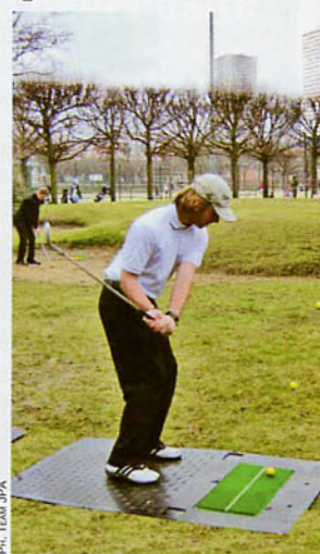
Après Boulogne et Auteuil, le golf fait son apparition dans le 13 e arrondissement de Paris.